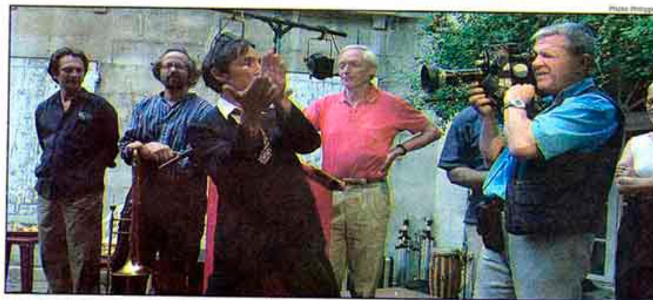
La compagnie L'Excuse a commencé le tournage de son court-métrage, véritable fil rouge de cette 8 e édition.

L'intrigue est simple : un tueur à gages est chargé de régler son compte à une personnalité niortaise. Restait à savoir qui jouaient les principaux protagonistes. Pour le