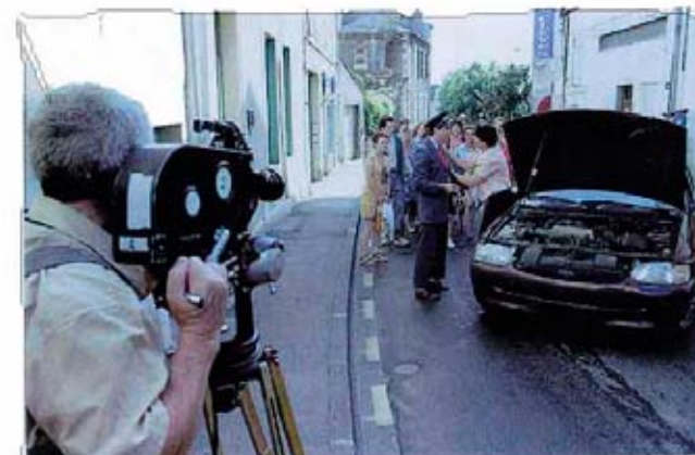
Nevers 2001, Tous dans le Pano, maquette pilote faisabilité.

Repérages, répétitions, tournage, montage et projection pendant le festival.... une première ! un film sur Nevers, avec des comédiens amateurs ou professionnels et des habitants de Nevers