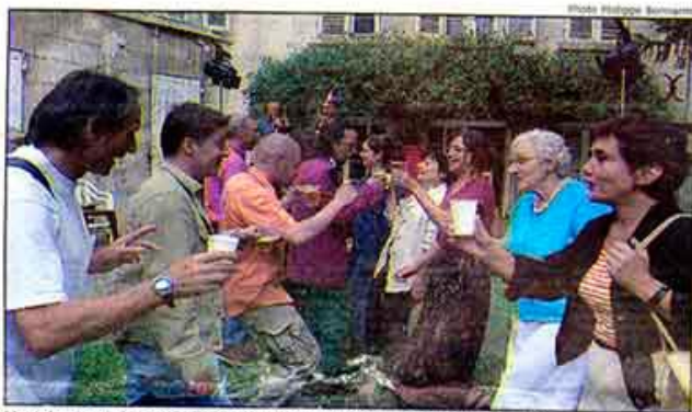
Une cinquantaine de personnes étaient rassemblées au Fort Foucault.

Le programme aujourd'hui ven 28 juin : 18 heures et 20 heures : - Brusca - au Fort Foucault ; 19 h 20 heures et 22 heures - Urban, drum bass - au Moulin du Roc ; - Maza Neutron - à 18 heures au Moulin du 20 heures - Un certain endroit du ver au Moulin du Roc (participation de 21 heures, Circus Ronaldo au Pré-L (participation à €) ; 21 heures - Cc tiempo - au CAMJI ; 22 h 30, L'Exc Moulin du Roc ; 23 h 30, Pierre-Ma Nouvel au Moulin du