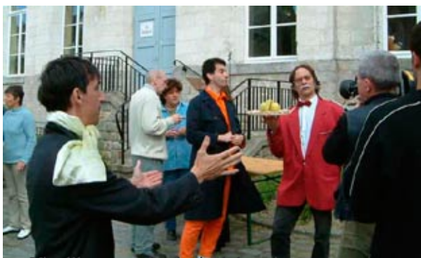
Vin d'honneur du festival, le poison.