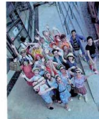
Images du tournage de "TOUS DANS LE PANO" "silent movie performance"... projet original, conçu et réalisé par Dominique LAJOUX, de la Compagnie L'EXCUSE

Repérages, répétitions, tournage, montage et projection pendant le festival.... une première ! un film sur Nevers, avec des comédiens amateurs ou professionnels et des habitants de Nevers