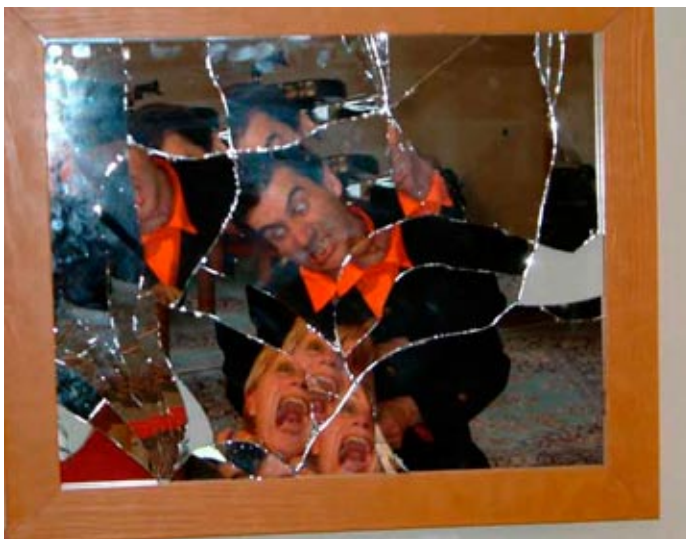
Le cri qui tue.

Tous dans le Pano , création à Béthune, festival Zarts Up Mai 2002. Culture Commune Loos en Gohelle.