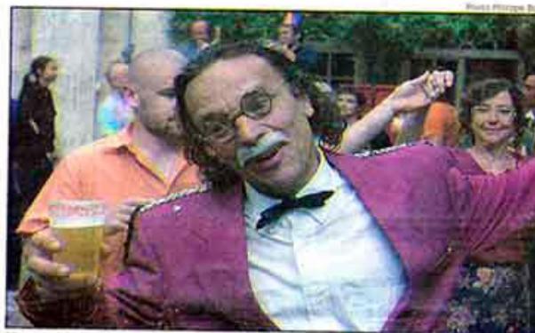
Une ambiance de banquet de noces planait sur l'inauguration.