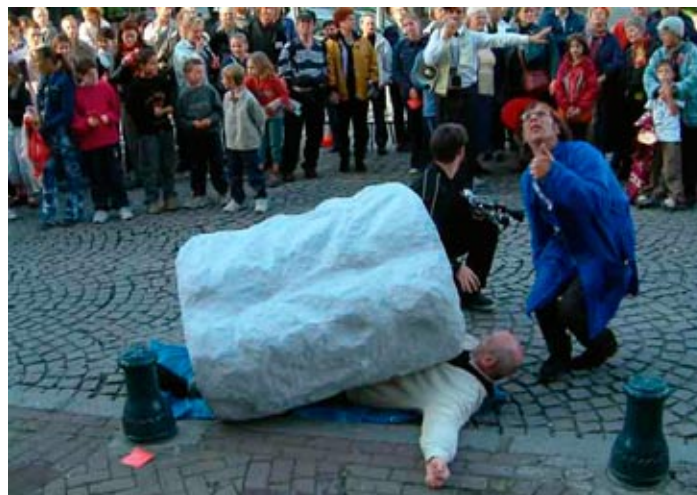
Tous dans le Pano, sous le balcon de la mairie, le vol du rocher.